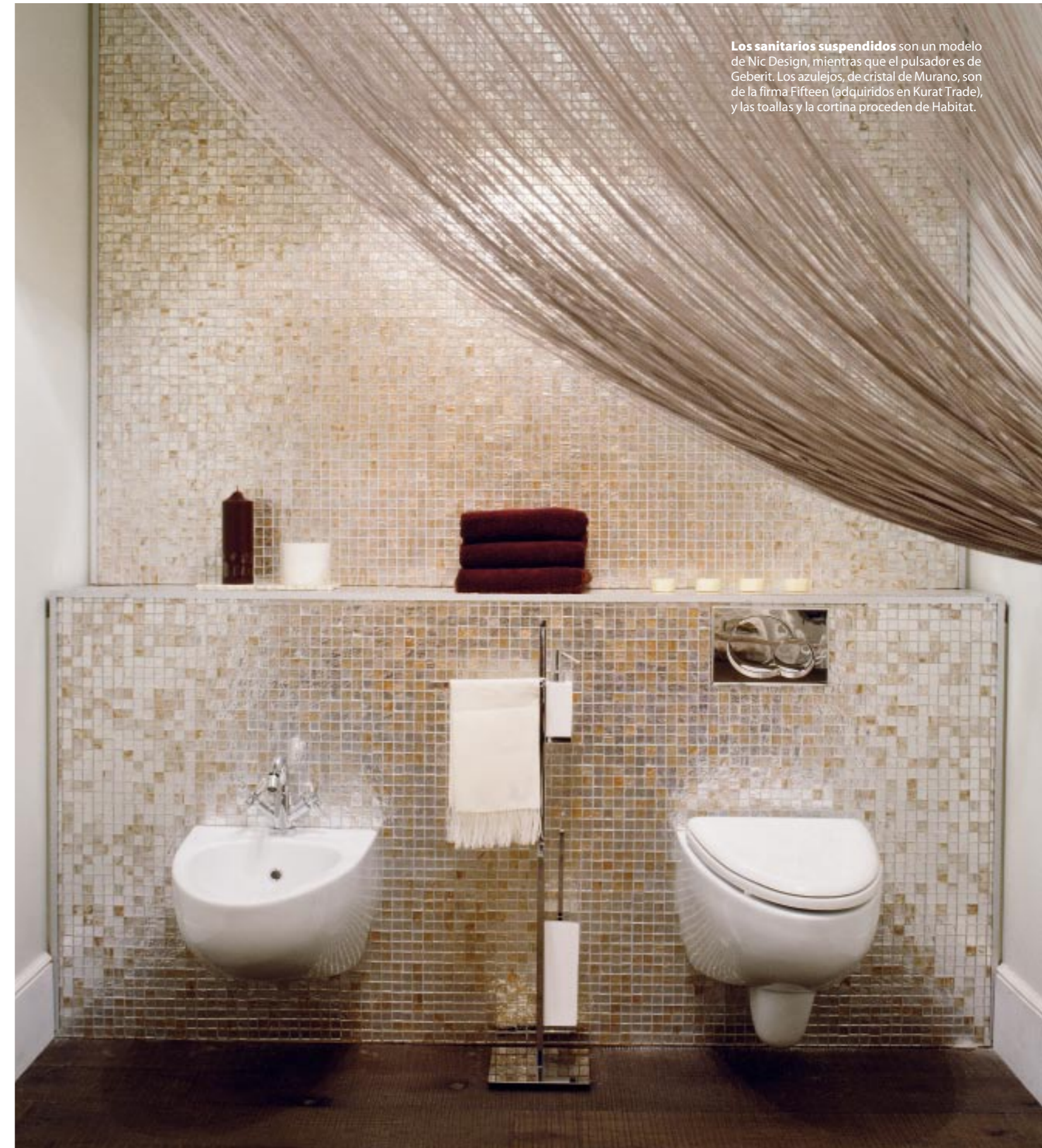
Los sanitarios suspendidos son un modelo de Nic Design, mientras que el pulsador es de Geberit. Los azulejos, de cristal de Murano, son de la firma Fifteen (adquiridos en Kurat Trade), y las toallas y la cortina proceden de Habitat.