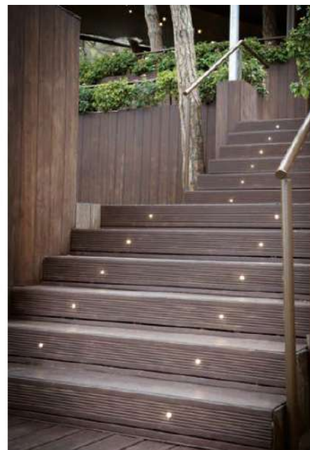
HOTEL ALBRIGA (PLATEN)